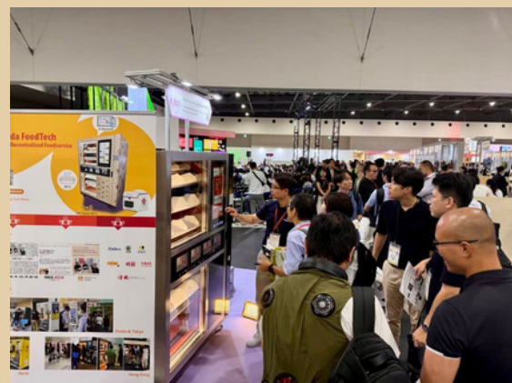
Crowds gathered at Wada FoodTech's Demo Area

そのリアルタイム実演は、投資家・イノベーター・一般来場者から大きな注目を集め、食品物流と自動化の未来を変革する可能性が高く評価されました。